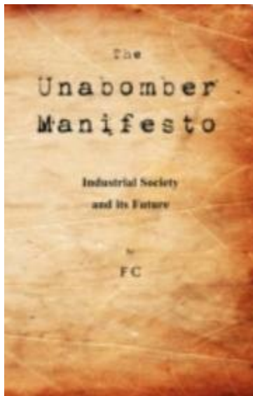
A Manifesto egy nyomtatott kiadása

Theodore John Kazcynski No. 04475-046 US Penitentiary—Max P.O. Box 8500 Florence, CO 8126-8500 USA