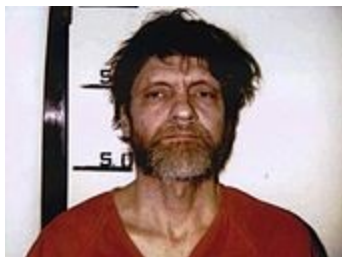
Ted Kaczynski elfogásakor

Kaczynski korábbi áldozatainak, és sajtóorgánumoknak is küldött leveleket, amelyben leírja később ismertetett álláspontját, elveit, és magyarázattal szolgál tetteire. Nagy nyilvánosság előtt azonban így sem fejthette ki nézeteit, holott a Kiáltványból egyértelműen kitetszik, hogy egy világszintű forradalmárcsoportban látja az ipar-technológiai rendszer leváltását. Hogy nagyobb embertömeghez juttassa el mondanivalóját, másfél évtizednyi sikeres merényletsorozattal a háta mögött, további gyilkosságokkal fenyegetőzve követelte a hatóságoktól az Industrial Society and its Future (röviden Unabomber Manifesto ) esszé leközlését