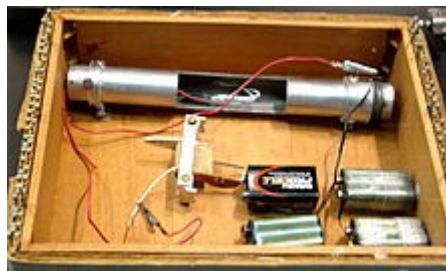
Egy bomba rekonstrukciója

állni: a motorkerékpárok zajára például az útra merőlegesen, fejmagasságban kifeszített húrokkal válaszolt. Az öt felettébb zavaró repülőgépek moraja ellen nincs hatásos védekezés, és átfogó eredményt sem képes elérni kisztílv szabotázsakciókkal, ebből kifolyólag kezdetleges levélbombák gyártásába kezdett, hogy ekképp ejtsen sebet az öt zaklató technológiai rendszeren, és bosszulja meg a számára oly kedves anyatermeszetet ért támadást. Esszéjében ezt azzal magyarázza, hogy e drasztikus lépésekkel próbálta felhívni magára a tunya átlagember figyelmét. Egy interjúban megemlíti azt a konkrét esetet is, amikor elszakadt benne a cérna: a kedvenc kirándulóhelyére aszfalt utat építettek, megrontva így a gyönyörű tájképet. „El tudják képzelni, milyen ideges lettem? Ott, és akkor elhatároztam, ahelyett, hogy tovább képezném magam a túléléshez szükséges ismeretekkel, behajtom a rendszeren az okozott károm. Visszavágó következik.” *